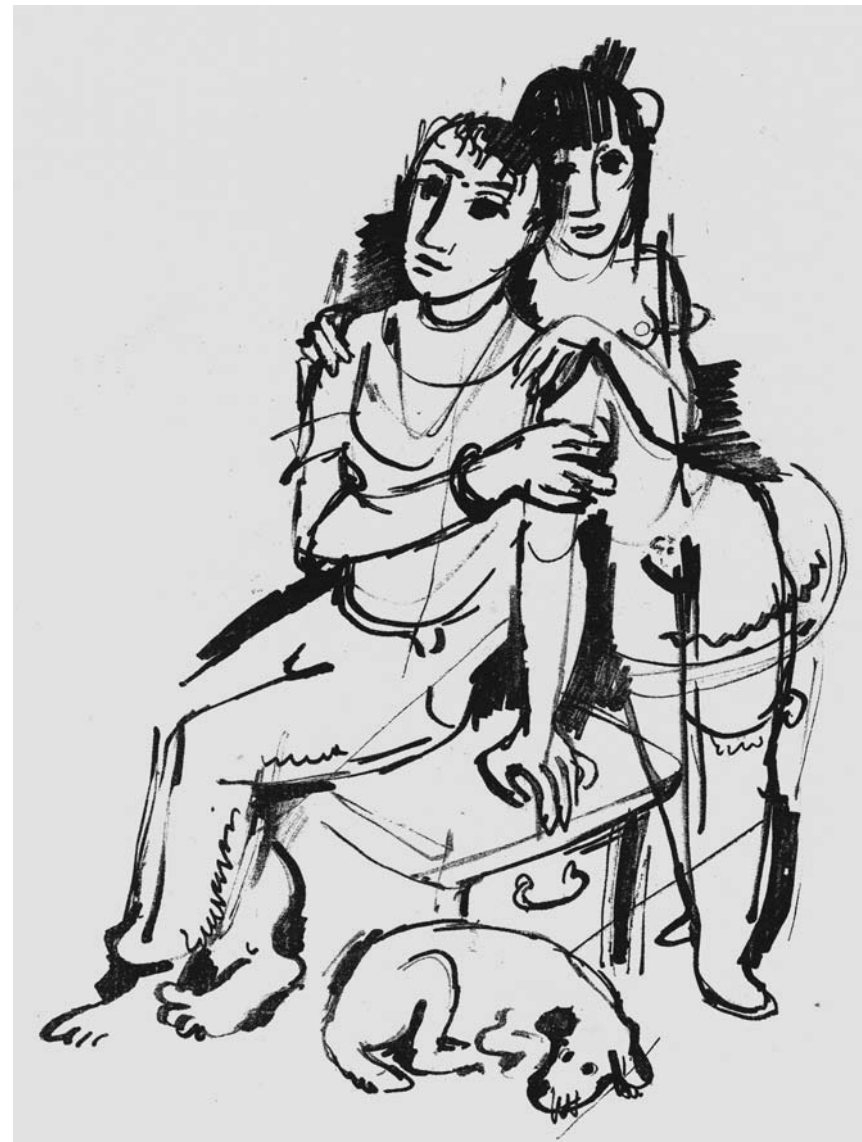
Paar mit Hund, undat., Rohrfeder-Lithographie. Wie ein Kuss vom Stein!