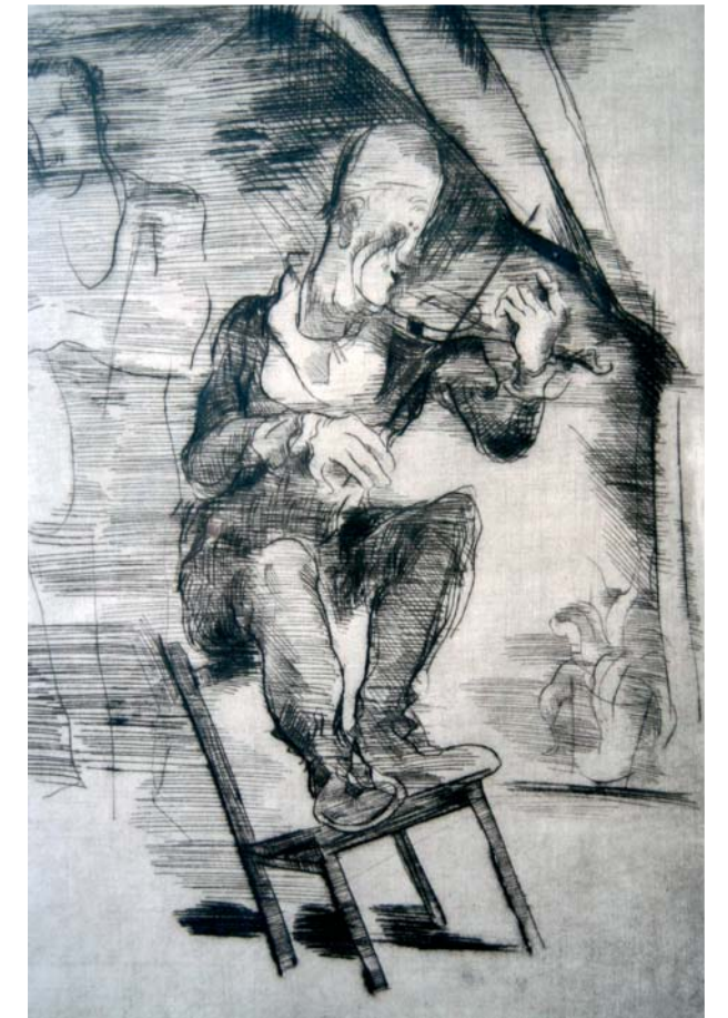
Grock, Kaltnadelradierung, unsign.

nungen zählen immer zum intimsten Aspekt im Schaffen eines Graphikers, erzählen sie doch, wie seine Geschichte einst begann.“ Und da sie einer frühen Phase entstammen, sind sie auch die Chronik seiner Vorbereitung zur Dreidimensionalität späterer Emailsöpfungen. Früh hatte er sich der graphischen Kunst zugewandt. „Die hohe Qualität seiner Graphiken“, urteilte ein Kunstkritiker, „beruhe auf der gekonnten Betonung der Umrissse, verbunden mit einem Wechselspiel von Licht und Schatten. Die Kunst des Weglassens sei ein besonderes Merkmal seiner Arbeiten. Es sei dann aber jede Linie von Ausdruck erfüllt und vermittele eine unmittelbare Wirkung.“