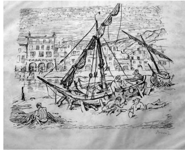
Spanische Hafenszene, sign., Feder-Lithographie, vermutlich aus Mitte der 20er oder Anfang der 30er Jahre