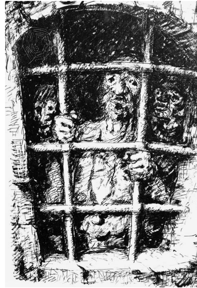
Der Gefangene, Lithographie, unsign. Mit der Feder auf den Stein gezeichnet. Die gröberen Striche wurden mit wenig Tusche auf den Pinselborsten aufgetragen. Um reichere Strukturen zu erzielen, wurde auf getrockneten Flächen geschabt. Ein dichtes, an Kubin erinnerndes Liniengeflecht