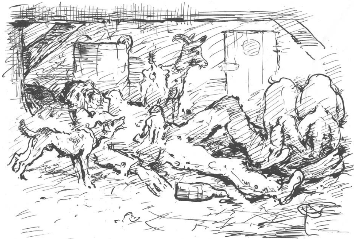
Betrunkenen Knecht im Stall, Feder-Lithographie, sign.